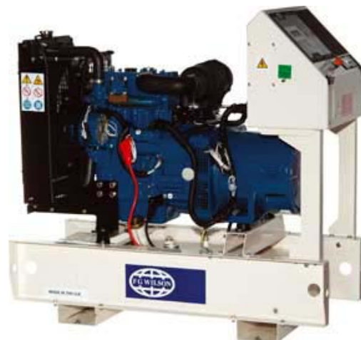
Immagine riportata a solo scopo illustrativo