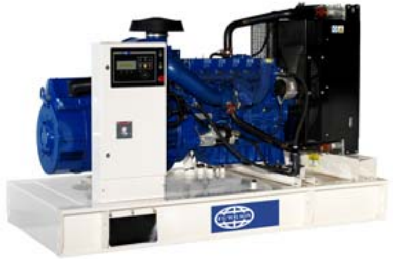
Immagine riportata a solo scopo illustrativo