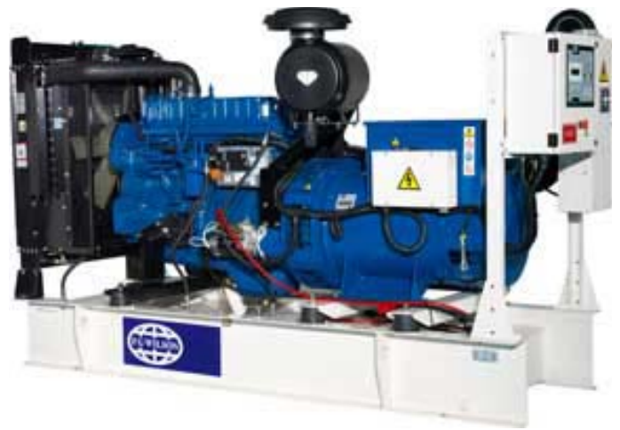
Immagine riportata a solo scopo illustrativo